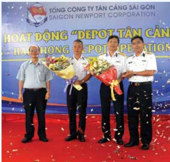
■ Lãnh đạo TCSG và Chủ tịch Quận Hải An chúc mừng khai trương.

Nằm trong Khu công nghiệp Minh Phương, Đình Vũ với diện tích 11ha, Depot Tân Cảng - Hải Phòng đi vào hoạt động trước mắt sẽ cung cấp các dịch vụ bãi container, vận chuyển, đồng thời là trung tâm bảo trì phương tiện vận tải cho Công ty CP Vận tải bộ Tân Cảng.