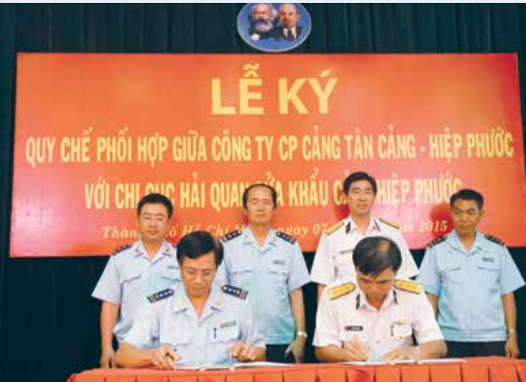
■ Lãnh đạo hai đơn vị ký quy chế phối hợp.

Ngày 7/7/2015 tại cảng Tân Cảng - Hiệp Phước đã diễn ra Lễ ký kết quy chế phối hợp giữa Công ty cổ phần Cảng Tân Cảng - Hiệp Phước với Chi cục hải quan cửa khẩu cảng Hiệp Phước