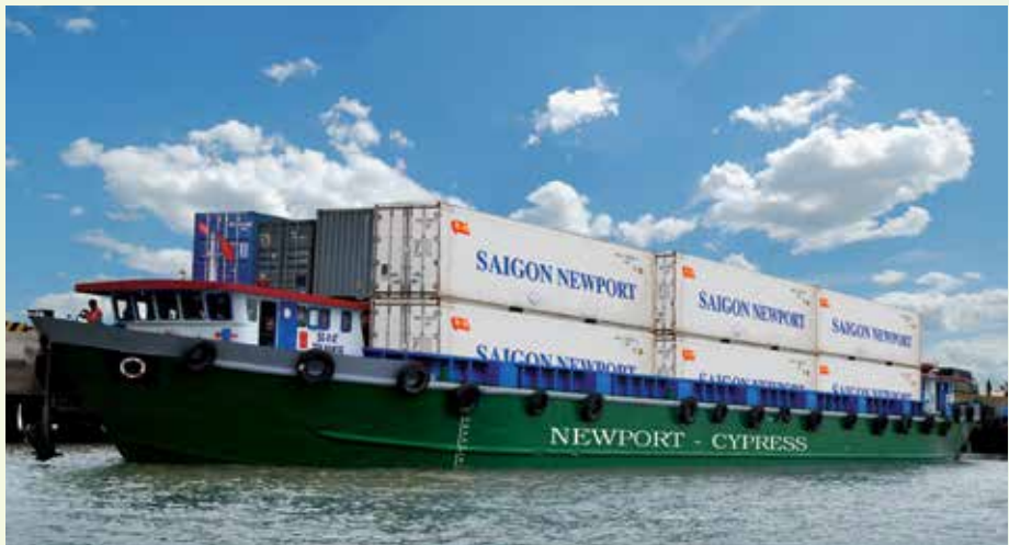
■ Sà lan của Công ty CP Tân cảng Cypress

Hiện tại tất cả các Hãng tàu đang có dịch vụ tại TCIT/TCOT và CMIT đều sử dụng dịch vụ vận chuyển sà lan của Tân Cảng - Cypress. Tháng 8/2013,