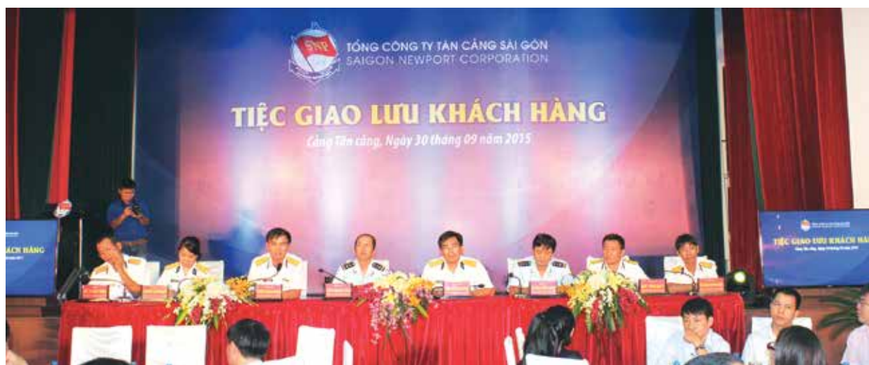
■ Lãnh đạo SNP và Hải quan chủ trì đối thoại, giao lưu với khách hàng.

N gày 30/09/2015, Tổng công ty Tân Cảng Sài Gòn (SNP) đã tổ chức buổi giao lưu khách hàng sử dụng dịch vụ đóng gạo nhằm tăng cường mối quan hệ hợp tác tốt đẹp với các khách hàng xuất khẩu gạo và cập nhật những cơ sở mới, chính sách mới của SNP đối với mặt hàng gạo Việt Nam.