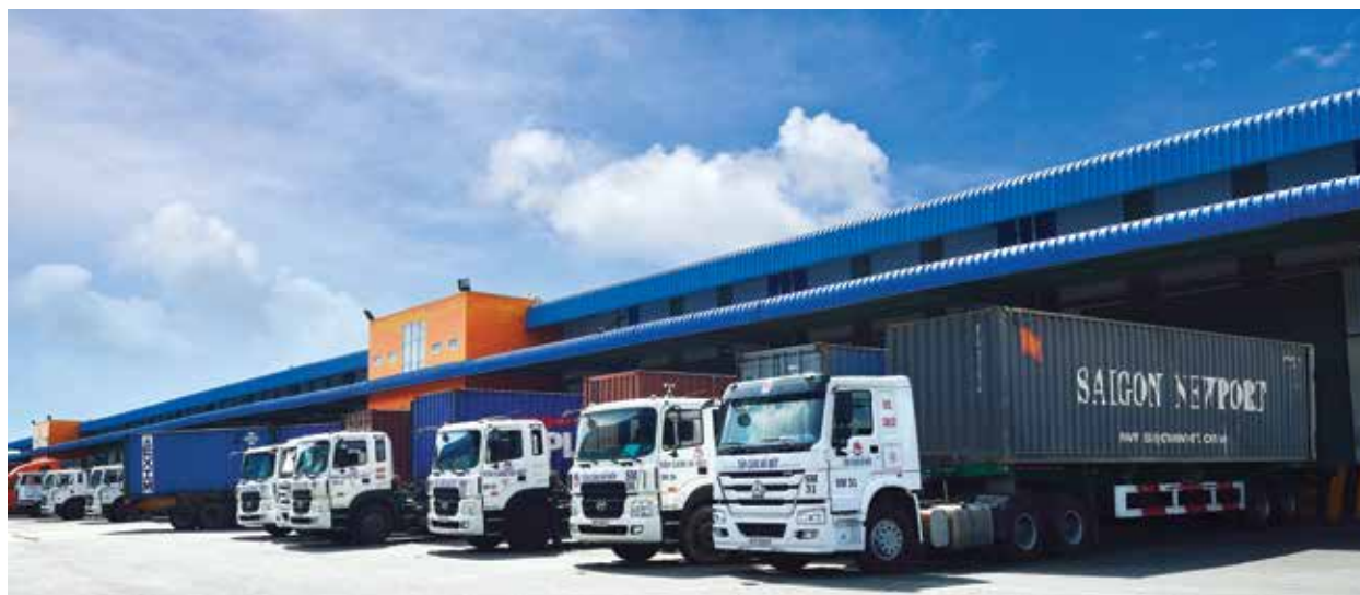
■ Kho hàng tại ICD Tân Cảng - Long Bình