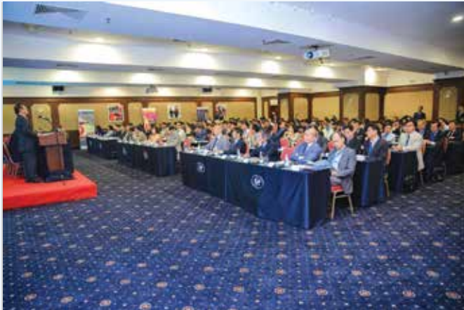
■ Quang cảnh diễn đàn.