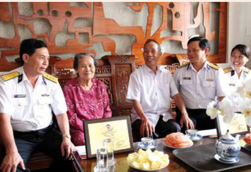
■ Tổng Công ty chúc thọ bố mẹ người lao động.