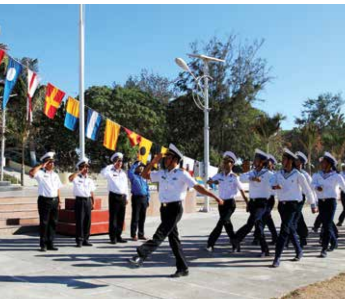
■ Duyệt đội ngũ trên đảo Song Tử Tây

Những người chiến sỹ hải quân “Sẵn sàng chiến đấu, chấp nhận hy sinh để bảo vệ biển trời, hải đảo thiêng liêng của Tổ quốc”; các chiến sỹ cũng giống như chúng ta, thân thể và trái tim đều được làm bằng máu thịt, họ cũng có bố mẹ già, vợ trẻ, con thơ, đứng giữa biển trời mệnh mang nỗi nhớ và cảm xúc dâng tràn... Thế nhưng tất cả được nén chặt trong lòng, nỗi nhớ ấy được hun đúc thành nghị lực, ý chí và niềm tin để hoàn thành nhiệm vụ thiêng liêng, cao cả mà hơn 90 triệu đồng bào cả nước đã đặt trọn nơi đây. Tôi cảm phục sự hy sinh tuổi trẻ của họ, lý tưởng sống của họ khiến tôi phải nghiêng mình. Dầu bao gian khổ, thiếu thốn, họ vẫn chắc tay súng với niềm, lý tưởng sống cao đẹp và sự lạc quan vào tương lai, vào cuộc sống. Chiến sỹ Trường Sa đang dang hiến những thứ quý giá nhất của một đời người cho Tổ quốc: đó là sức trẻ, tuổi thanh xuân và khi cần là cả mạng sống... Trên các đảo Nam Yết, Trường Sa Lớn, tôi thực sự nghẹn ngào khi được thấp những nén tâm hương cho các chiến sỹ vì sự toàn vẹn lãnh thổ của Tổ quốc Việt Nam, các anh đã nằm lại với biển đảo quê hương tại các nghĩa trang... Trên những bia mộ, có khắc những cái tên còn rất trẻ, tuổi đời của các anh còn nhiều ước mơ dang dở... Nhìn những khẩu hiệu “Đảo là nhà, biển cả là quê hương” hiện hữu khắp nơi trên các đảo nổi, đảo chìm, nhà giàn, sự cảm phục và tự hào ấy trong tôi được nhân lên gấp bội.