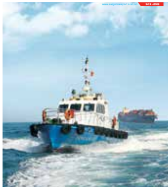
Bìa 1: Tàu Tân Cảng P3 đưa Hoa tiêu đi nhận nhiệm vụ

BẢN TIN TÂN CẢNG SÀI GÒN SAIGON NEWPORT TIMES