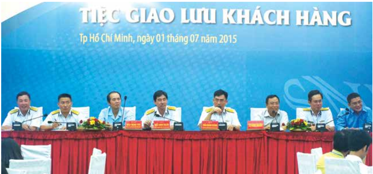
■ Lãnh đạo SNP và Hải quan chủ trì đối thoại, giao lưu với khách hàng.