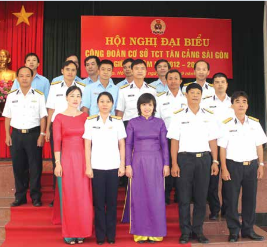
■ Ban chấp hành Công đoàn cơ sở giữa nhiệm kỳ 2012 - 2017

N gày 24/9/2015, Công đoàn cơ sở Tổng công ty Tân Cảng Sài Gòn đã tổ chức thành công Hội nghị đại biểu Công đoàn cơ sở giữa nhiệm kỳ 2012-2017.