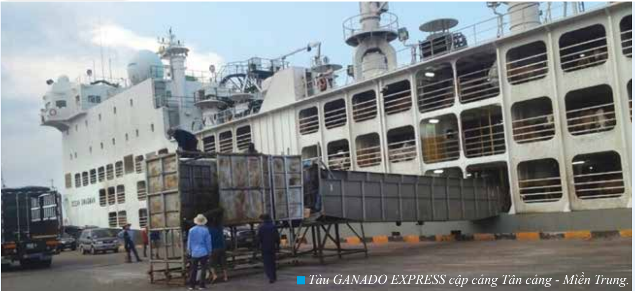
■ Tàu GANADO EXPRESS cập cảng Tân Cảng - Miền Trung.