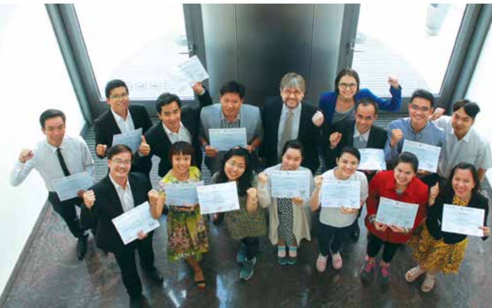
■ Lễ trao chứng chỉ đào tạo tại trung tâm AGKN – Đức

Với hệ thống Cảng và cơ sở logistics xuyên suốt từ Nam ra Bắc cho thấy vị thế là nhà khai thác cảng hàng đầu của Tổng Công ty Tân Cảng Sài Gòn (TCT TCSG). Cách đây hơn 3 năm khi dịch vụ logistics được Ban Lãnh đạo TCT xác định là trụ cột kinh doanh thứ hai với thương hiệu SNPL (Saigon Newport Logistics), mấy ai nghĩ rằng hiện nay SNPL đứng vị trí số 1 trong 20 doanh nghiệp cung cấp dịch vụ logistics hàng đầu của Việt Nam. Có nhiều yếu tố làm nên sự thành công này, trong đó “định hướng đúng đắn trong công tác đào tạo nhằm nâng cao trình độ cho đội ngũ cán bộ, nhân viên kinh doanh dịch vụ logistics ở SNPL, đáp ứng yêu cầu ngày càng cao về quản trị chuỗi cung ứng, kết nối.