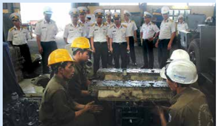
■ Đoàn Công ty Hải sản Trường Sa thăm Công ty CP DV KT Tân cảng tại Cát Lái.

Tại phòng họp số 2 Cát Lái, 2 đơn vị đã có buổi gặp mặt, giới thiệu và trao đổi một số hoạt động truyền thống cũng như những dịch vụ mới, đồng thời đề ra chủ trương phối hợp, hợp tác trong thời gian tới.