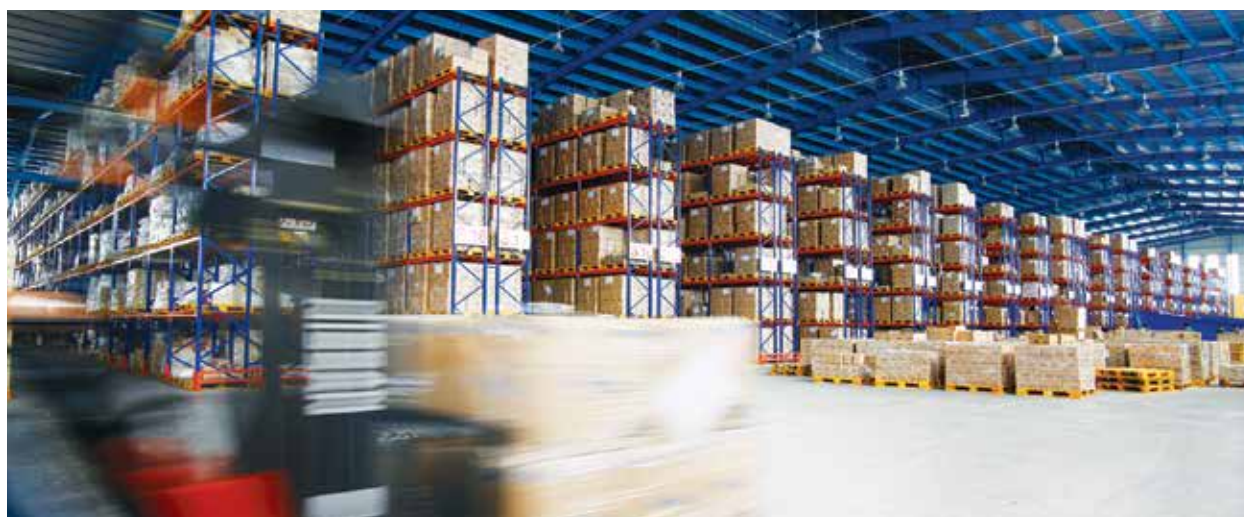
■ Kho hàng tại ICD Tân Cảng - Sóng Thần

Năng, Kỳ Hà, Chân Mây), cảng hàng không, nhà ga, bến xe, các khu công nghiệp, các cửa khẩu (thuộc tỉnh Quảng Nam).