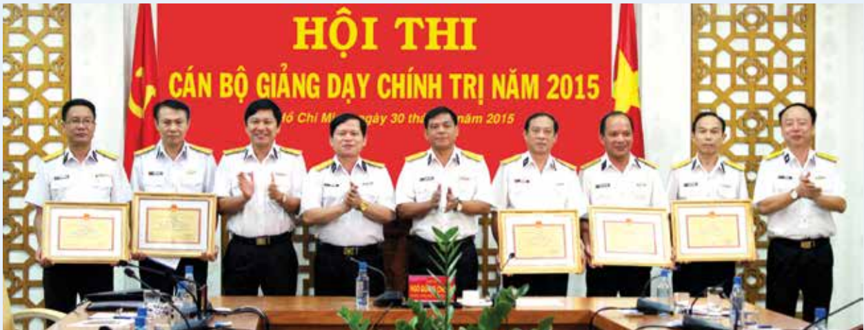
■ Trao thưởng hội thi Cán bộ giảng dạy chính trị 2015.