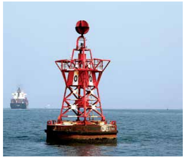
■ Phao số 0 - nơi đón và trả hoa tiêu tại khu vực Vũng Tàu.

Tàu hành trình trên luồng xuyên qua những phương tiện đang di chuyển ngược xuôi, khi màn đêm bao phủ tầm nhìn bị hạn chế, đôi khi có những phương tiện không có tín hiệu...đòi hỏi người hoa tiêu ngoài những kỹ năng chuyên môn, còn phải có cả những năm kinh nghiệm dày dặn mới có thể hướng dẫn tàu hành trình một cách an toàn tuyệt đối.