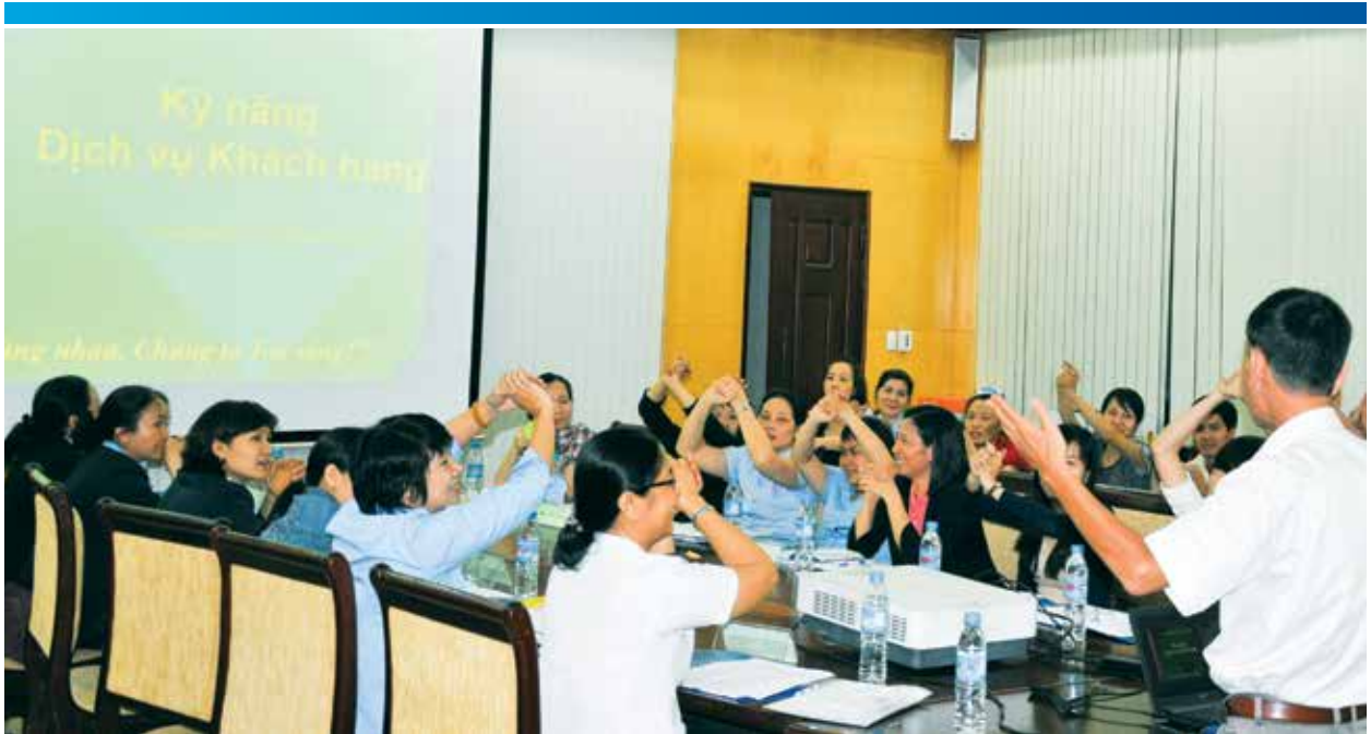
■ Không khí lớp học khoá Kỹ năng Dịch vụ Khách hàng.

và phương thức hành động mới mẻ, nhiều động lực và chuyên nghiệp hơn. Với các khóa cập nhật hàng năm, tin tưởng sau một thời gian Tân Cảng Sài Gòn sẽ nâng cao hơn nữa tính chuyên nghiệp và dần định hình phong cách riêng của mình trong cung cấp dịch vụ khách hàng.