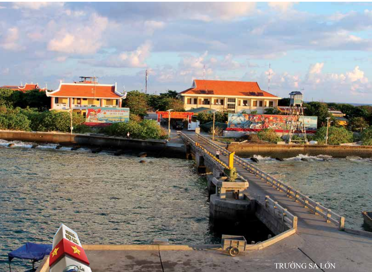
TRƯỜNG SA LỚN