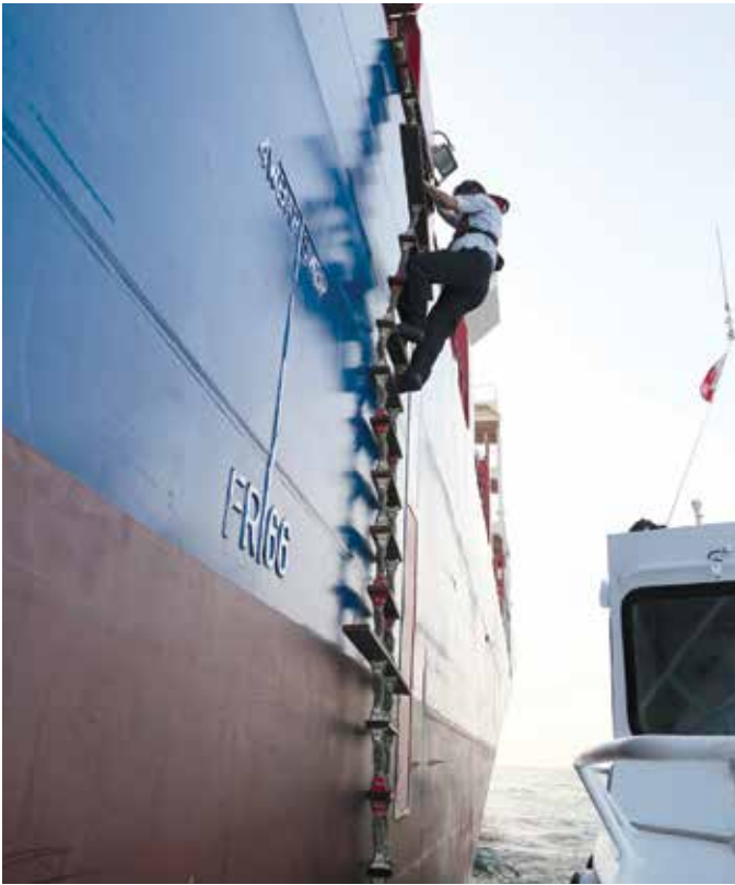
■ Làm nghề hoa tiêu là phải biết leo thang dây, và leo bảo đảm an toàn trong mọi điều kiện khắc nghiệt

16g20: con tàu rời cảng Cát Lái dưới sự kết hợp điều khiển của hoa tiêu, thuyền trưởng và những con tàu lai hiện đại nhất của Tân cảng. Trong khi chúng tôi còn đang ngỡ ngàng từ độ cao buồng lái của một con tàu to lớn và chớ đầy hàng hóa, thì hoa tiêu đã làm nhiệm vụ của mình từ những phút đầu tiên.