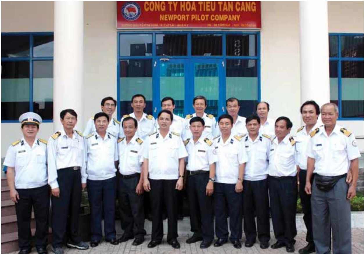
■ Tổng Giám đốc TCT TCSG và những Hoa tiêu Tân Cảng ngày đầu thành lập.