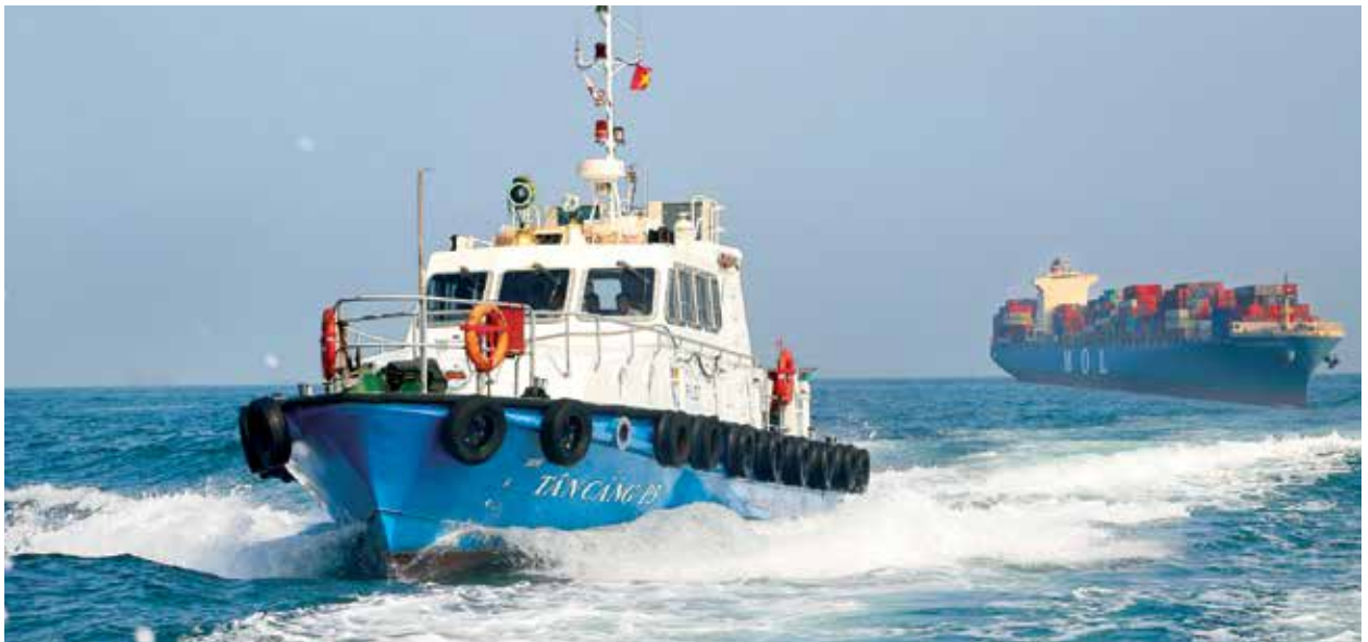
Tàu Tân Cảng P3 đưa Hoa tiêu đi nhận nhiệm vụ.

cảng Tân cảng Cái Mép xuất hiện lung linh ánh đèn điện soi bóng xuống dòng sông cùng những âm thanh làm hàng vang xa trong đêm tĩnh mịch – chưa kịp vui mừng vì công việc dẫn tàu sắp kết thúc tốt đẹp, chúng tôi được thông báo, thời gian quay tàu và điều động tàu cập bến an toàn có thể kéo dài từ 30 phút đến cả giờ đồng hồ, tùy vào điều kiện khách quan. Với máy bộ đàm trong tay hoa tiêu Hải đi ra khỏi buồng lái và điều động tàu cùng với sự hỗ trợ của tàu lai. Lúc này dưới cầu cảng, những người công nhân đang đứng chờ lệnh của hoa tiêu và thuyền trưởng để bắt dây – một công đoạn cuối cùng trước khi hoa tiêu hoàn thành nhiệm vụ và rời tàu.