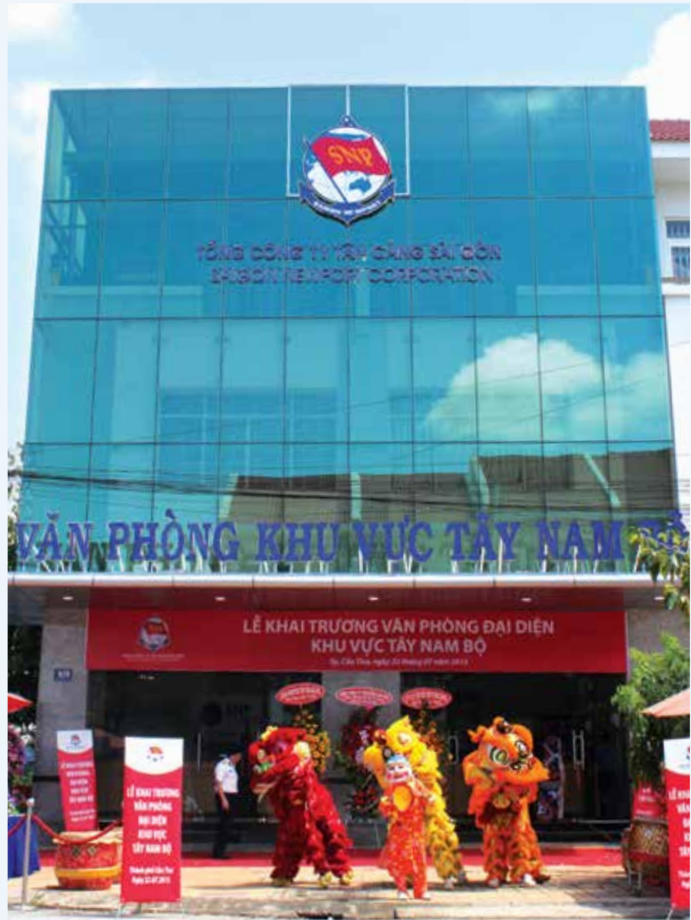
■ Văn phòng TCSG khu vực Tây Nam Bộ tại Cần Thơ

đóng góp cho kinh tế khu vực Tây Nam Bộ nói chung, thành phố và địa phương nói riêng. Tại đây, đại diện đội ngũ làm công tác thị trường của SNP cùng lực lượng thuộc Trung tâm Dịch vụ logistics Tân Cảng, Công ty cổ phần Vận tải thủy Tân Cảng, Công ty cổ phần Tân Cảng - Cypress, Công ty cổ phần Vận tải biển Tân Cảng và Công ty Tiếp vận Tân Cảng - Mekong sẽ kết nối và triển khai các dịch vụ kinh tế biển đa dạng như khai thác cảng, logistics, vận tải thủy, vận tải biển nội địa, vận tải sà lan liên tuyến Campuchia nhằm gia tăng sản lượng hàng hóa, container thông quan qua các cảng, giảm thiểu chi phí logistics, giảm thời gian vận chuyển, đảm bảo chất lượng dịch vụ, đáp ứng ngày càng tốt hơn các nhu cầu của khách hàng ■