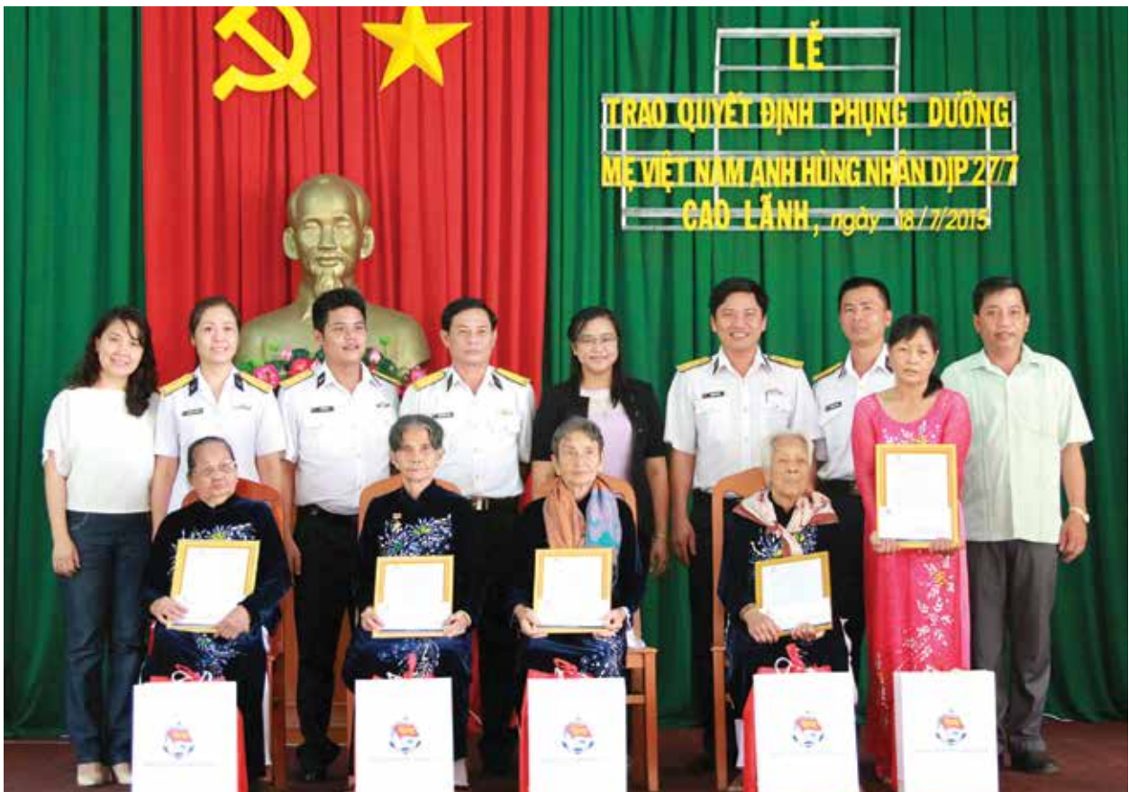
■ Lãnh đạo TCSG và Ban Quản lý Quỹ trao quyết định phụng dưỡng suốt đời Mẹ VNAH tại tỉnh Đồng Tháp

Đã xuất hiện các mô hình “Dân vận khéo” có sức lan toả mạnh mẽ như: mô hình “Xây dựng